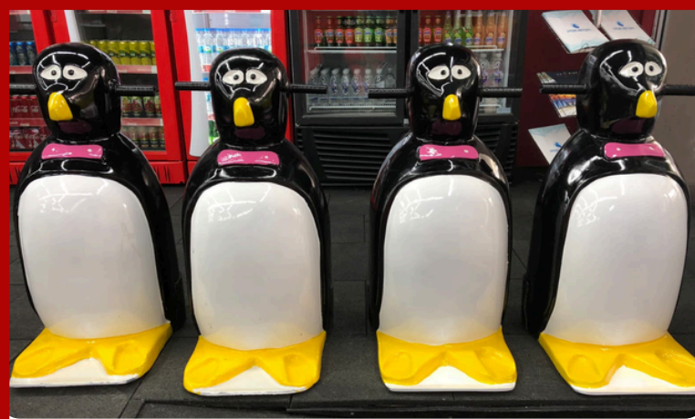
Buz Pateni Yardımcı Ekipmanı