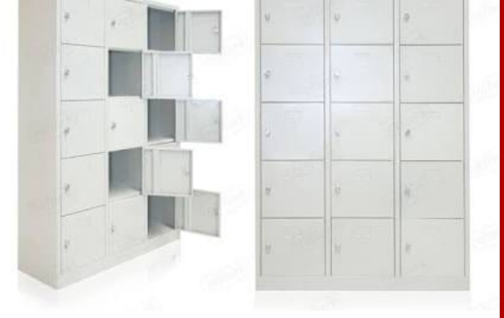
Buz Pisti Özel Eşya Dolabı