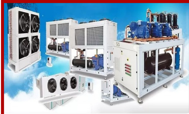
Buz Pisti Soğutma Grupları