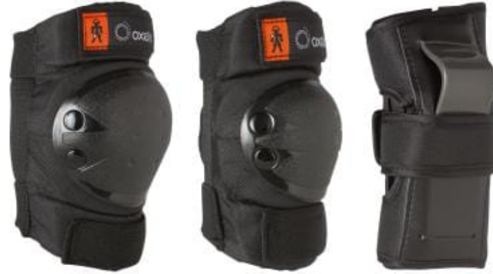
Buz Pateni Koruma Ekipmanları