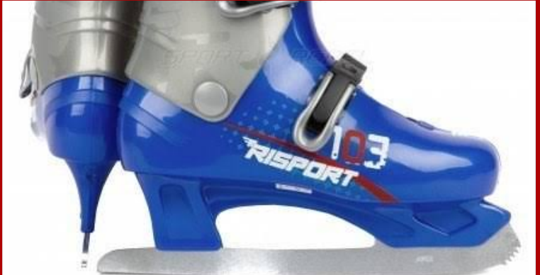
Buz Pistleri Rental Pateni