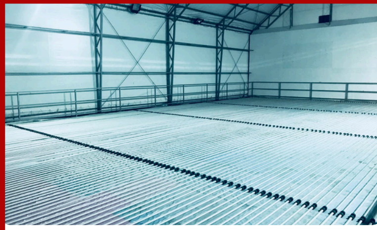
Doğal Buz Pisti Alt Yapı Sistemi