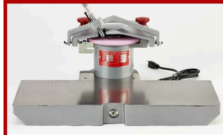
Paten Bileme Makineleri