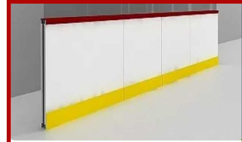
Buz Pisti Bord Sistemleri