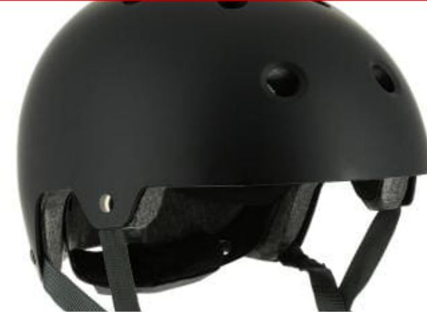
Buz Pateni Kaskı