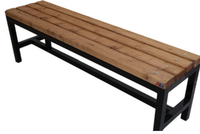
Buz Pisti Oturma Bankı