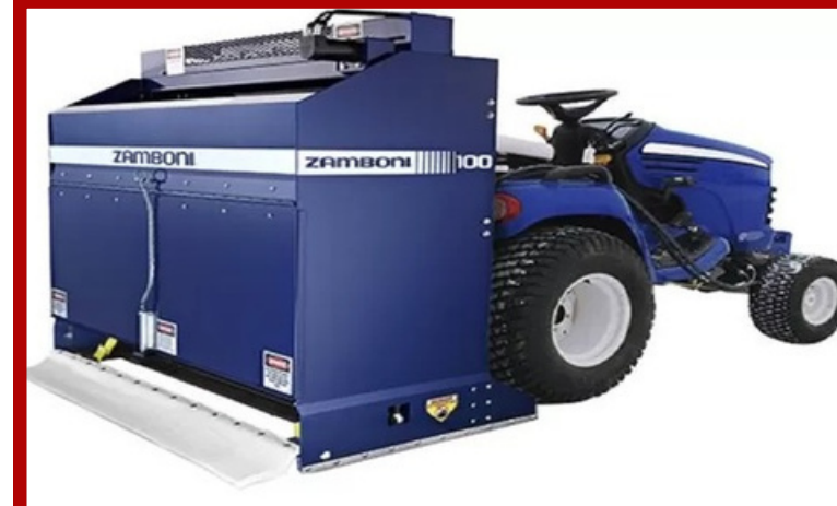
Buz Pisti Temizleme Araçları