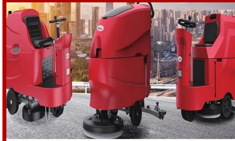
Zemin Temizleme Makineleri